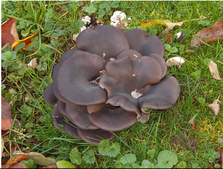
Austernseitling, er lebt auf Holz, das sich im Boden verbirgt.

Für jedermann sichtbar hat in diesen Tagen die Pilzsaison begonnen. Jetzt schießen sie wieder sprichwörtlich aus dem Boden. Aber woher kommen sie, wie konnten sie entstehen und wovon leben die Pilze im Rasen? Sind sie gefährlich? Sollte man sie bekämpfen?