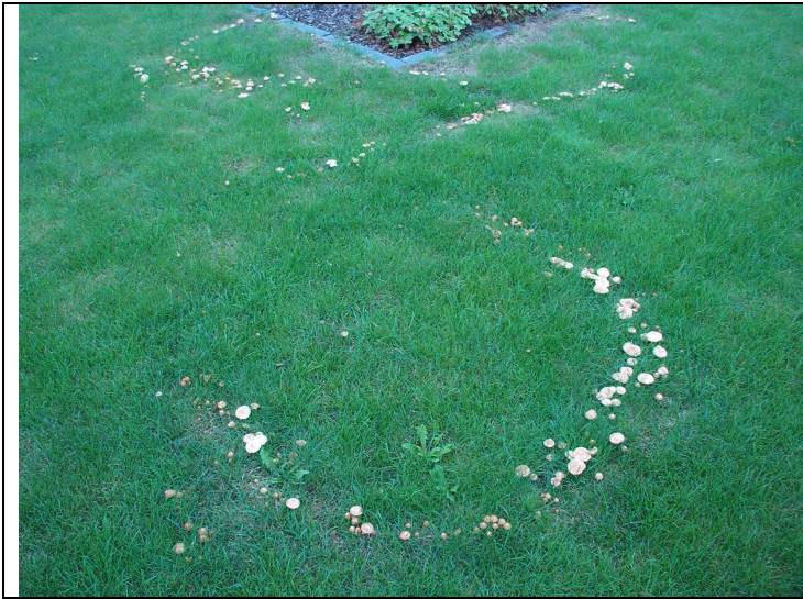
Nelkenschwindling ( Marasmius oreades ), eine mögliche Ursache für den Hexenring.

Auffällig ist, dass die Fruchtkörper vieler Pilze (u.a. Wiesenchampignon, Knollenblätterpilz und Nelkenschwindling) in kreisrunder Anordnung erscheinen.