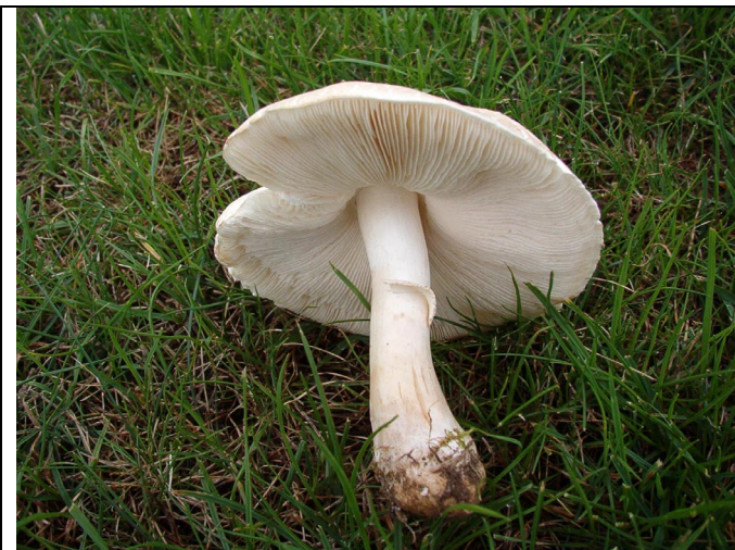
Weißer Knollenblätterpilz ( Amanita virosa )

Zu den häufigsten und bekanntesten Pilzen im Rasen gehört der Feldegerling oder Wiesenchampignon ( Agaricus campestris ). Er hat keinen Einfluss auf das Gräserwachstum. Der schmackhafte Pilz hat einen weißen Hut unter dem sich zunächst rosafarbene und im älteren Zustand dunkel schokobraune Lamellen befinden.